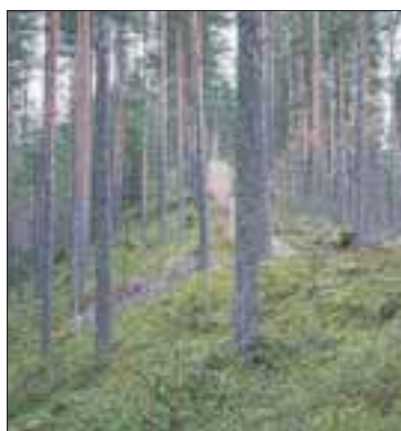
Parkkilanharjun selänne kuuluu yleiskaavan alueeseen.

Ristiriitaiset odotukset kohtaavat Siilinjärven ja Maaningan kuntien laatimassa harjualueen yleiskaavaluonnoksessa, joka tulee nähtäville huomenna. Siilinjärven kaavoitusarkkitehti Otto